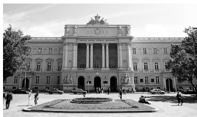
Український вільний університет у м. Мюнхені

Загальна частина підручника складалася з передмови та восьми розділів, поділених на підрозділи. У передмові автор зазначив мету: «не тільки показати широкі обрії, що їх відкрили для криміналістики нові досягнення інших дисциплін: як медицина, хімія, техніка тощо, але також виробити в нашого правника спосіб стисло-криміналістичного думання та дати йому хоч би мінімум теоретичного знання з цієї ділянки» [1, с. 1].