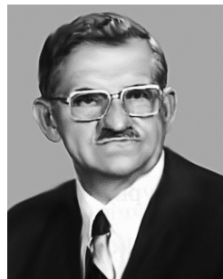
С. П. Гик

У розділі I висвітлено основні постулати науки кримінології, до якої, на думку автора, входила і криміналістика. Розділ складається з двох підрозділів: «Завдання криміналістики» та