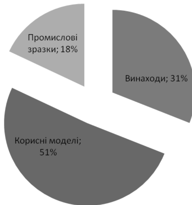
Рис. 2 Співвідношення кількості отриманих охоронних документів на об'єкти промислової власності, створених у МВС України та ЦОВВ, діяльність яких спрямовується і координується через МВС України станом на I квартал 2017 р.

З огляду на відображені дані на рис. 1–2 можемо констатувати, що загалом отримано 505 патентів на об'єкти промислової власності, створених у МВС України та ЦОВВ, діяльність яких спрямовується і координується через МВС України, з них 153 патентів України на винаходи, 262 патентів України на корисні моделі та 90 патентів України на промислові зразки. Найбільші показники винахідницького рівня та інноваційної діяльності показали навчальні та наукові заклади МВС України та ДСНС України. За ними йдуть структурні підрозділи МВС України та КП НВО «ФОРТ» МВС України. Позитивна тенденція реєстрації власних результатів науково-технічної діяльності свідчить про їх прагнення не тільки закріпити за ними авторство, але й отримати виключне право на використання та розпорядження власними розробками.