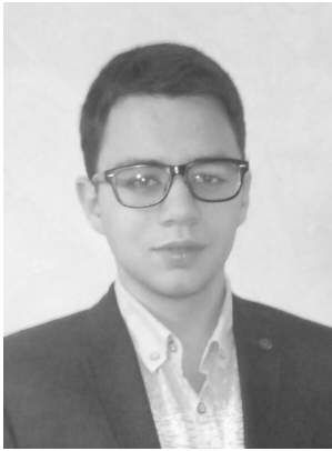
студент, Одеський національний університет імені І.І. Мечникова