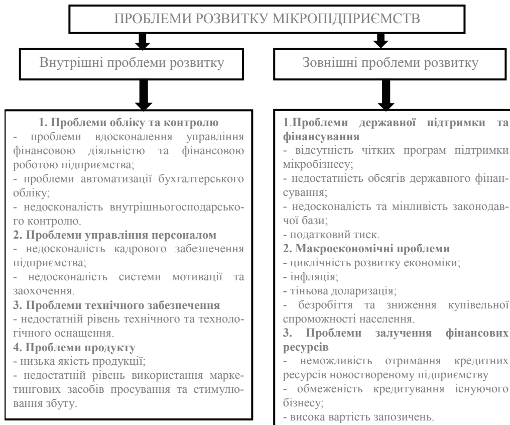
Рис. 2. Проблеми розвитку мікропідприємств