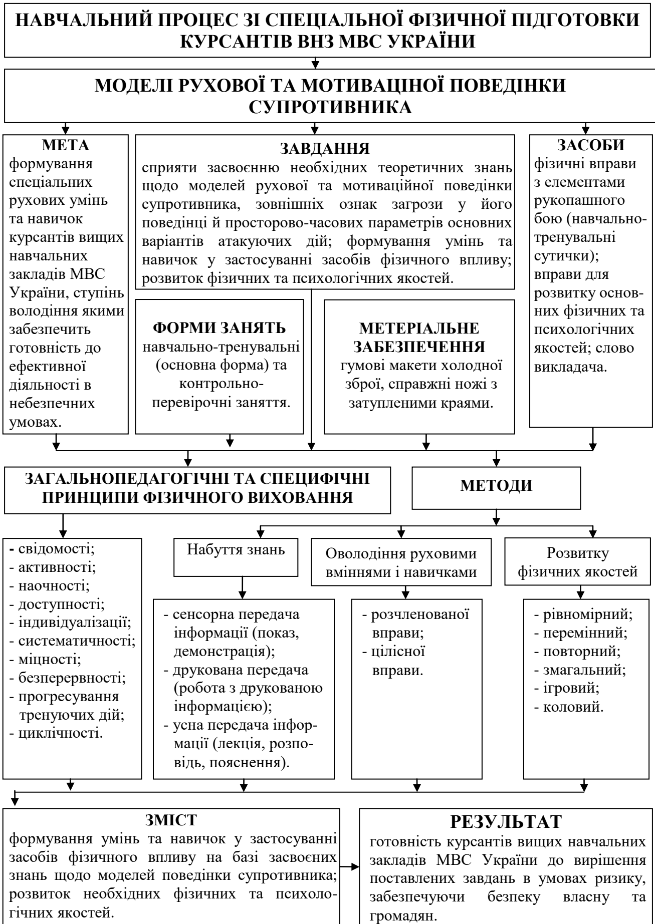
Рис. 3. Блок-схема складових авторської методики формування рухових умінь та навичок курсантів вищих навчальних закладів МВС України