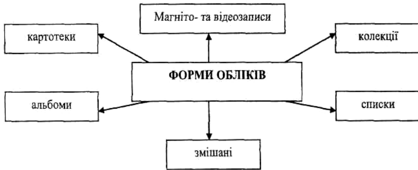
Схема 1. Форми криміналістичних обліків

Можна запропонувати такі форми обліків та способи фіксації обліків (див. схеми 1, 2).