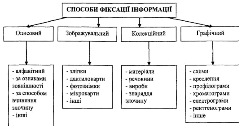
Схема 2. Способи фіксації інформації

злочинності і міжнародному тероризму. Але офіційній дипломатії та вузькопрофесійному співробітництву правоохоронних органів – не все під силу. Необхідно об'єднати зусилля здорових сил усіх країн і єдиним фронтом виступити проти інтернаціонального різномовного криміналу. Перші кроки в цьому напрямку вже зроблені. Створено Всесвітній Антикримінальний і Антитерористичний Форум зі штаб-квартирою у Берліні.