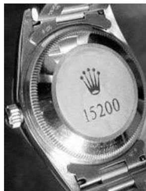
Рис. 3. Наклейка на корпусі годинника «ROLEX»

На задній частині годинників марки «ROLEX» має бути наклейка з голограмою (рис. 3.)