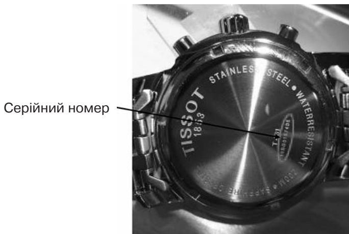
Рис. 8. Розташування серійного номера на задній кришці корпусу годинника «TISSOT»