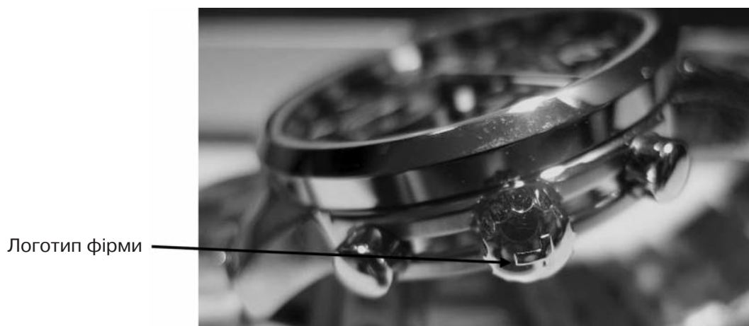
Рис. 1. Буква «Т» на заводній голівці годинника марки «TISSOT»

На заводній голівці багатьох дорогих моделей годинників вигравійовано логотип фірми (рис. 1).