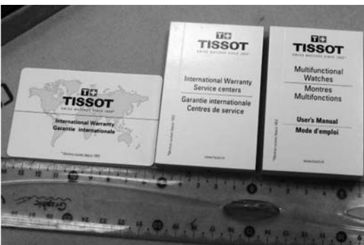
Рис. 6. Загальний вигляд коробки годинника марки «TISSOT»