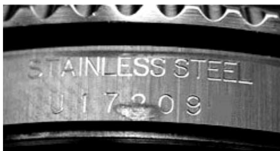
Рис. 4. Гравіювання серійного номера годинника «ROLEX»

На бічній частині корпусу має бути серійний номер (у підробок це гравіювання доволі поганої якості (рис. 4).