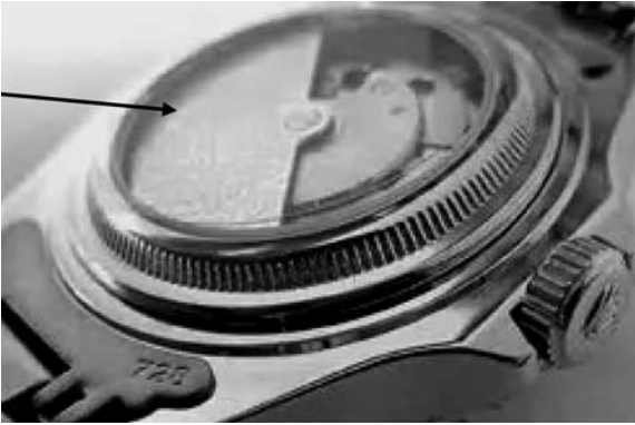
Рис. 5. Кришка з прозорого скла у підробленому під марку «ROLEX» годиннику

наручних годинників, що у подальшому дає змогу експерту-товарознавцю достовірно встановити вартість об'єкта дослідження.