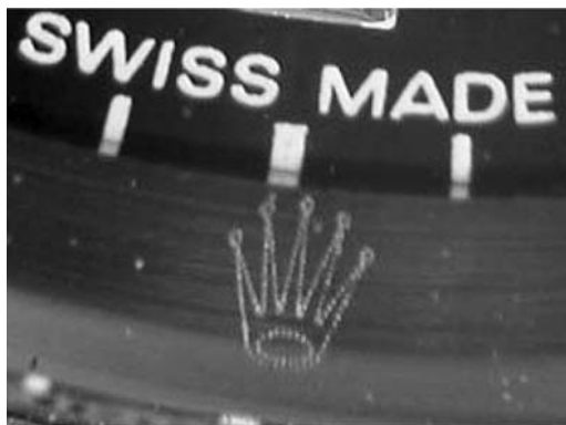
Рис. 2. Емблема «ROLEX» у вигляді корони

Також на корпусі годинника може бути рельєфна емблема марки або певної серії. Для «ROLEX» це обов'язково корона, яку на підробленому годиннику видозмінено (зокрема під цифрою 6), розгледіти її можна лише за допомогою збільшувального скла. При цьому емблему зроблено доволі якісно, тобто все чітко промальовано (рис. 2).